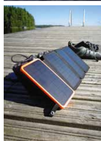
Typisch Finnische Seenplatte: Übernachtungshütten mit drei Wänden, einem Dach darüber und einer Feuerstelle davor. Solarpanels gehören ins Gepäck – sonst kann man Smartphone und Fotoapparat bald vergessen.

»Die Natur beeindruckt derart, dass ich keine Begleitung vermisse. Ich habe Bücher dabei, hole sie aber fast nie aus den Packsäcken.«